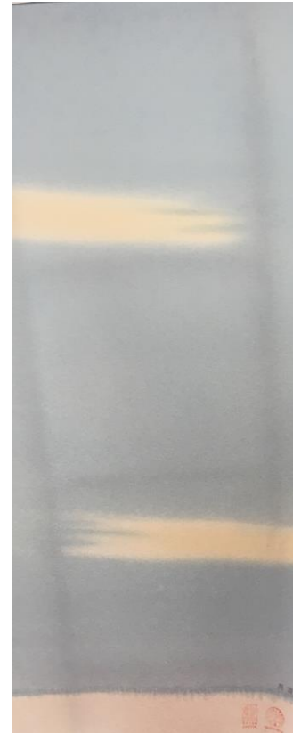
百趣矢野 特選ぼかし染め ¥324,500