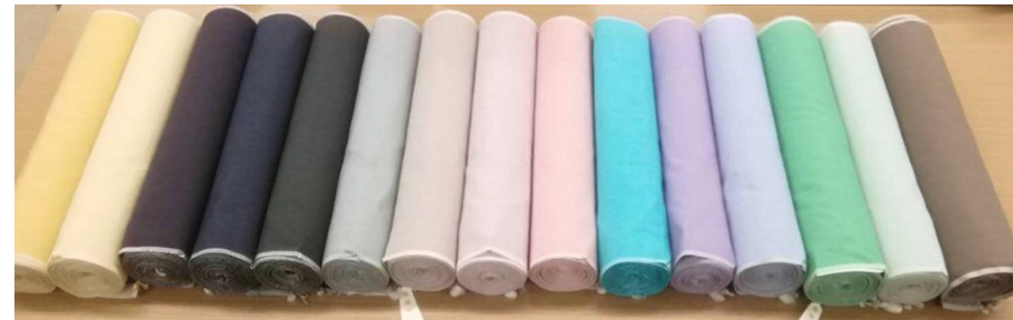
奥順 結城紬 はたおり紬