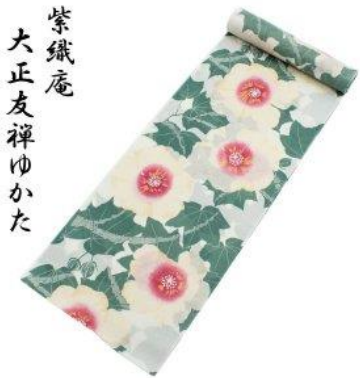
「紫織庵・大正友禅」